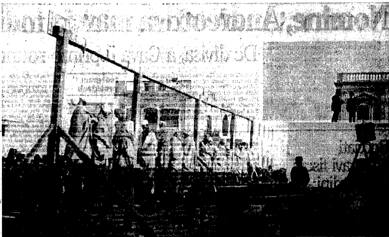
5 I libici oppongono una fiera resistenza all'occupazione italiana. È quindi necessario, secondo gli alti comandi italiani, dare un esempio. Nella piazza del Pane a Tripoli, davanti alla popolazione, vengono impiccati 14 ribelli.