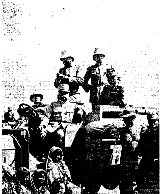
1 Il generale De Chaurand, comandante la terza divisione, in posa con il proprio stato maggiore subito dopo la conquista da parte italiana di una oasi nel deserto della Tripolitania.