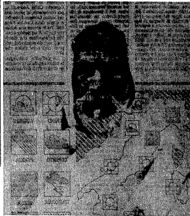
7 Il capo «ribelle» Omar El Muktar soprannominato dai libici «il leone del deserto». Verrà catturato l'11 settembre del 1931, portato a Bengasi e impiccato, dopo un processo sommario e un colloquio con il vicegovernatore Rodolfo Graziani.