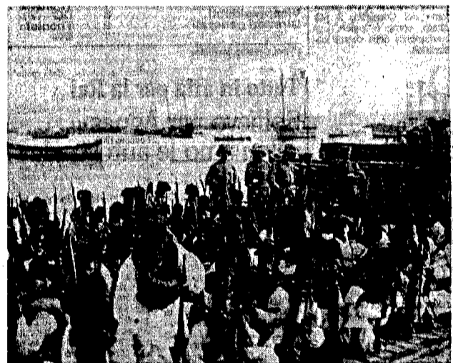
2 11 ottobre 1911: sbarcano, nella rada di Tripoli, le prime truppe italiane. Contro i libici vengono utilizzate truppe di colore della colonia Eritrea, al comando di ufficiali italiani.

Le assurde provocazioni di Gheddafi, le pretese senza senso e persino la sospetta uccisione di un italiano a Tripoli in queste ore di polemiche, non possono farci dimenticare la verità storica. Il colonialismo italiano in Libia (quello di Giolitti prima e quello di Mussolini poi) non è stato affatto «buono» e «diverso». I governi dell'epoca non hanno solo costruito qualche bella strada o qualche palazzo pubblico. Hanno anche dato l'ordine di uccidere, massacrare, impiccare e rinchiudere migliaia di persone nei campi di concentramento. Insomma, con ogni mezzo, si è cercato di schiacciare la resistenza dei libici contro chi aveva invaso il loro paese. Le foto che pubblichiamo vengono dagli archivi italiani sempre chiusi e poco accessibili per nascondere le «vergogne» nazionali. Sono state scattate dal capitano Armando Mola, da un maresciallo dell'esercito appassionato di fotografia e da un ufficiale medico