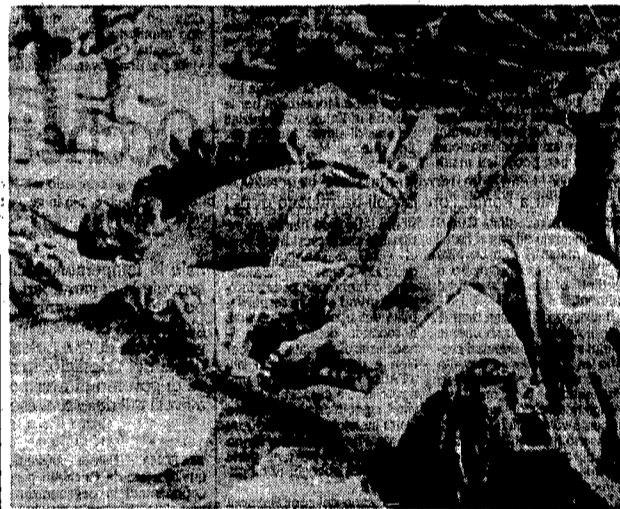
6 «Resistenti» libici e popolazione, massacrati nel 1912 dopo una dura battaglia nella località chiamata delle «Due Palme». La foto è stata scattata da un ufficiale medico italiano.