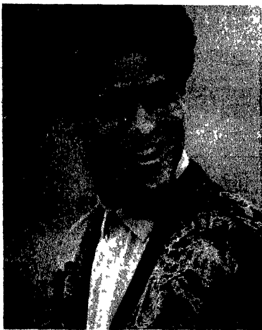
(pubblicità Pancaldi & B)