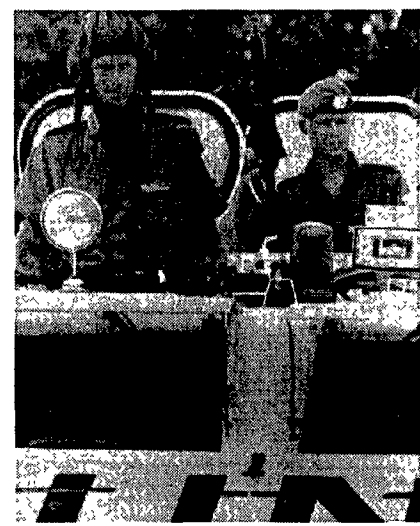
Forze dell'Onu in Namibia

ranno piazzati in posti chiave del governo. Questo è un messaggio segreto che non dovete confidare a nessuno, nemmeno a vostra moglie se non è di Ongandera». Il volantino che tutti ad Oshakati pensano opera della Alleanza democratica di Turhale (Dta) è la miglior testimonianza della «sindrome da elezione» che ha colpito i bianchi in questa regione. Si aspettano il peggio, lo dicono e lo dimostrano insultando non solo i giornalisti ma anche i bravi osservatori delle Nazioni Unite. Nella loro testa l'Onu è qui per proteggere, ingiustamente, quei selvaggi della Swapo. Molti se ne sono già andati, soprattutto i commercianti. Chi, come i funzionari, non sa dove scappare, vive arroccato in quella strana cosa che fino ad ora abbiamo chiamato Oshakati. È un ghetto vero e proprio, ma per i bianchi, circondato da un val-lum degno di Cesare nelle Gallie, con tanto di filo spinato e postazioni militari una