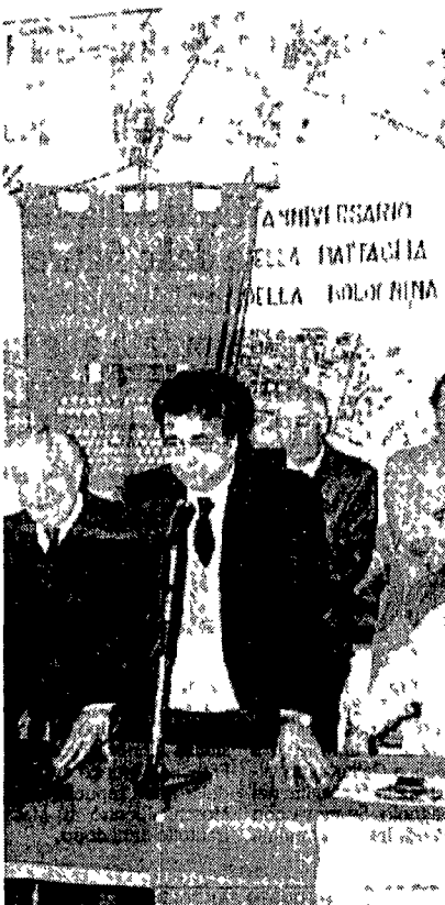
Il segretario del Pci, Achille Occhetto tra i partigiani che ieri hanno commemorato il 45° anniversario della battaglia della «Bolognina»

Napolitano: «Ricomporre le forze di ispirazione socialista» ROMA «Condanniamo le parole ispirate e responsabili di Willy Brandt, che proprio a Berlino dinanzi al muro finalmente caduto ha indicato la strada di un'Europa che torni a crescere insieme.