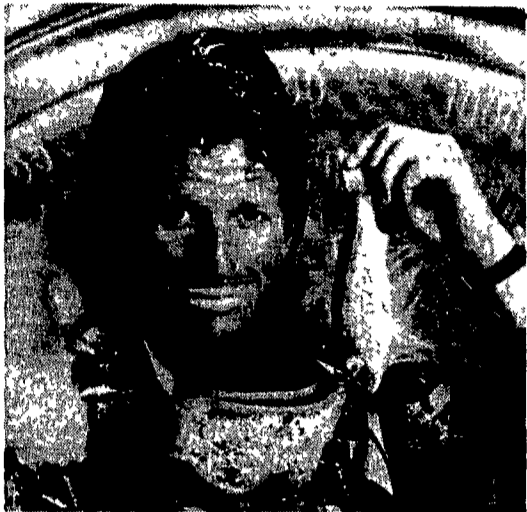
(depliant pubblicitario Swatch)

MOSCA - PIAZZA ROSSA: CELEBRAZIONI DEL 72° ANNIVERSARIO DELLA RIVOLUZIONE DI OTTOBRE