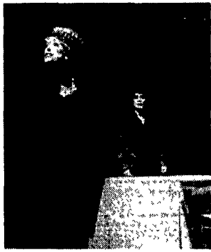
Da «Le tre sorelle» di Cechov per la regia di Ronconi