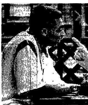
Spike Lee e Danny Aiello nel film «Fa' la cosa giusta»

Diritto d'amare , di Leonard Nimoy, con Diane Keaton e Liam Neeson. Da ieri al Rivoli. L'ultimo lavoro di Leonard Nimoy, ormai passato alla regia dopo aver appeso al chiodo le orecchie da Spock, è una storia d'amore che travolge una donna divorziata con figlia a carico, il marito le intenda una causa ritenendola una madre indegna per aver ricevuto il suo amante in casa davanti alla figlia.