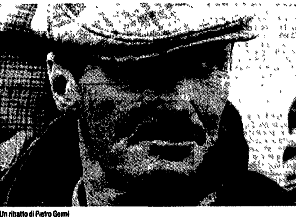
Un ritratto di Pietro Germi

Ripartire oggi, a quindici anni dalla morte, di Pietro Germi del suo cinema, della sua discontinua parabola esistenziale e creativa, mette addosso subito un disagio, un malessere di cui non sappiamo bene individuare le origini, le motivazioni, le cause. E, peraltro, ci rendiamo conto immediatamente che tali stesse ingombranti sensazioni sono determinate proprio e specificamente dall'indole, dalle attitudini temperamentali, diciamo pure espressive di un uomo come Germi, personaggio quanto altri mai spigoloso, scortuto, ma altresì artista, autore di naturale talento cinematografico. Sono note le traversie ininterrotte della sua vita privata, i triboli e le angosce dolorose di tempestose vicende coniugali, oltre a malattie logoranti che lo portarono prematuramente a morte non ancora scassiatore. E sono altrettanto conosciuti tentativi, esperienze cimenti e successi visivi con quasi maniacale ombrosità dal cineasta ligure, dagli anni degli inizi, nell'immediato dopoguerra, con il controverso, fuggiasco Il testimone , all'incompiuto, ambizioso progetto di Ama mia (poi realizzato, come si sa, dal collega e complice Mano Monicelli). Verranno poi, di lì a poco, nel colmo dei cosmici anni Cinquanta, le opere, diciamo così, «fondanti» per la crescen-