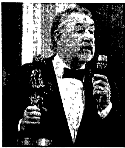
Philippe Noiret mentre ritira il Felix a Parigi