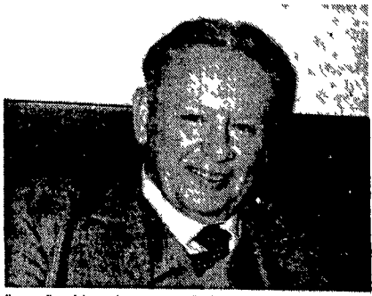
Il consigliere del presidente sovietico Zagladin