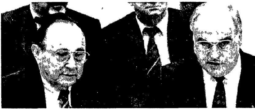
Hans-Dietrich Genscher ed Helmut Kohl durante la seduta del Parlamento della Germania occidentale (sotto)

Un lungo processo in una prospettiva di distensione e di cooperazione europea