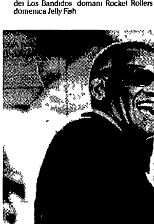
Ray Charles lunedì in concerto al Sistina

L'Esperimento Via Rasella 5. Oggi concerto dei Los Bandidos domani Rocket Rollers domenica Jelly Fish.