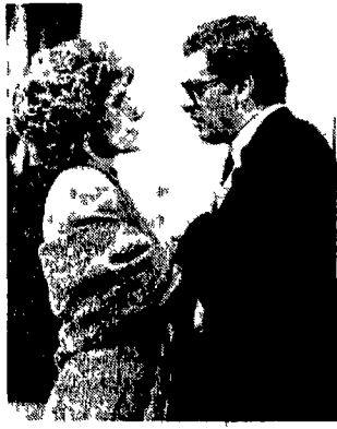
Ivana Monti e Andrea Giordana

Gli incontri della Proclemer e i pastori del duo Barra