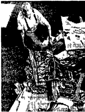
Atelier parigino di Jean Dubuffet 1976

Dubuffet e i monumenti fioriti dai graffiti