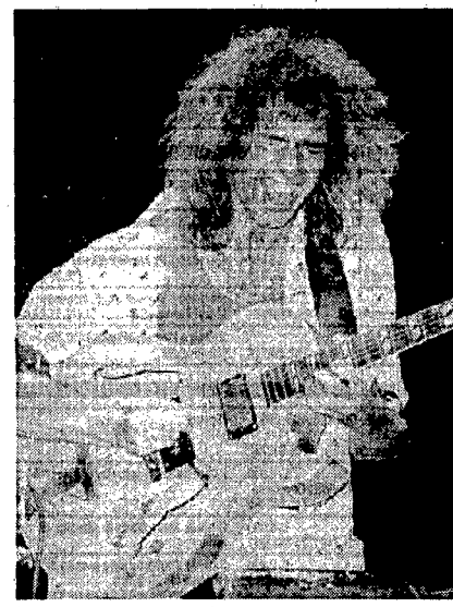
Pat Metheny in concerto martedì all'Olimpico

«dossifare» sia il jazzista più appassionato, sia il pubblico più vasto che ne apprezza la musica brillante, altrante, lo stile fluido, e accattivante. Ma Pat Metheny è anche un ottimo compositore in grado di capire e immaginare i principi armonici colomariani e proporli col suo strumento, la chitarra, offrendo uno stupefacente risultato carico di suggestioni. Di più con il «Pat Metheny Group», che dopo 12 anni di attività può essere considerata la più grande band di jazz elettrico in circolazione. Così ogni concerto si trasforma, un po' per la bravura dei musicisti, un po' per l'impegno di Pat che esige la perfezione assoluta del suono, in tre ore di musica unica e imperdibile.