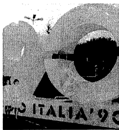
La grande scritta di Italia '90 davanti al Palaeur

procedura per stabilire la composizione dei gironi. Il segretario generale della Fifa Blatter anche ieri continuava ad insistere che tutto ormai è solo e soltanto nelle mani della capricciosa signora sorte, ma gratta gratta nonostante la sua grande abilità di poliglotta, saltellando da un idioma all'altro alla fine è costretto a dire parole «comprensibili» a tutti. Come si riuscirà a scongiurare il rischio che le teste di serie Brasile e Argentina incontrino nel primo turno le altre sudamericane Colombia e Uruguay? Blatter assicura che l'eventualità non è prevista. Ma come, non era tutta legata ai voleri della dea bendata? Ed ecco allora che le «mani