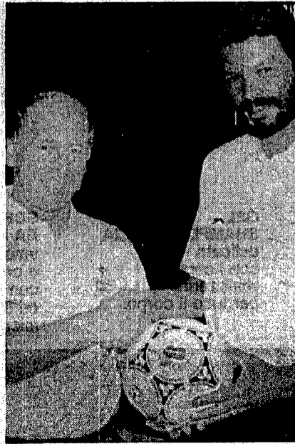
Due campioni, due epoche a confronto: Bobby Charlton e Socrates

ROMA. «Noi Come lo devo dire? Non c'è più posto per nessuno. Sul cancello d'entrata del Palaeur, il Col ha attaccato da giorni il cartello «Tutto esaurito» ma Luca di Montezemolo continua ad essere inondato di centinaia di richieste che arrivano da tutto il mondo negli uffici dell'hotel Midas. «Non riesco a capire - continua il direttore generale del Comitato organizzatore - la certezza del sorteggio è quanto di più televisivo esista, eppure nessuno vuole mancare. Forse per lo show che abbiamo preparato come contorno all'arida operazione dell'urna».