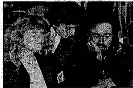
Il direttore generale del Col a colloquio con Luciano Pavarotti e Caterina Caselli, produttrice dell'Inno del Mondiale

stendere 15000 metri quadrati di moquette blu, costruire 33 postazioni video, fissare 25 chilometri di cavi elettrici e otto di luci al neon. Durante il sorteggio, oltre 700 poliziotti sono stati mobilitati per assicurare la vigilanza all'interno e all'esterno del Palaeur. Lungheissime, infine, la lista degli