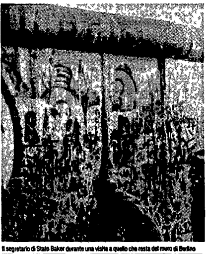
Il segretario di Stato Baker durante una visita a quello che resta del muro di Berlino