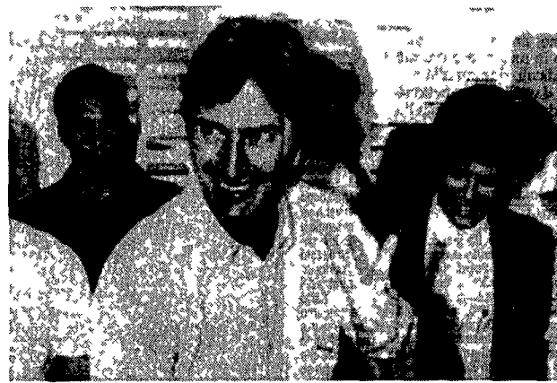
Fernando Collor festeggia la vittoria. Sarà presidente del Brasile