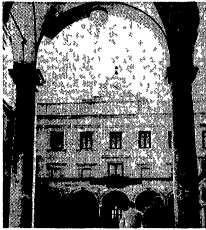
L'interno dell'Università di Palermo

Dura dal 5 dicembre nel pressoché assoluto disinteresse dei grandi mezzi di comunicazione di massa. Ma chissà da quando covava questo movimento di fine '89 che per ora cresce impetuoso con una sua strana allegria e disinca cantata «rabbia» nell'università di Palermo «contro il decreto Ruberti» per la partecipazione studentesca per il diritto allo studio. Si fanno assemblee, commissioni, gruppi di studio, seminari autogestiti su queste parole d'ordine apparentemente «moderate» ma che scoperchiano un vero mercato di problemi enormi e generali. Qualcuno ha trovato ed esposto in bacheca una prima pagina di «Liberazione» sull'università «trop plein»