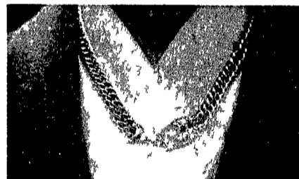
50 COLLIERI ORO 18 K CON PIETRE PREZIOSE BALESTRA 1882