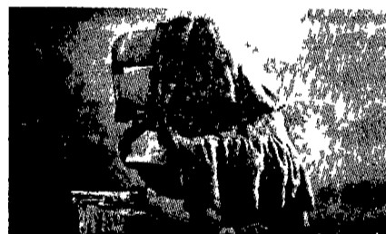
20 PRESTIGIOSE PELLICCE DI VISONE FRIGERIO

E avrete un Natale da mille e una notte.