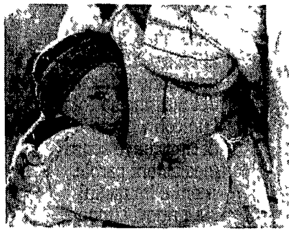
Un'immagine del piccolo Matteo Bellina nella parte di Gesù