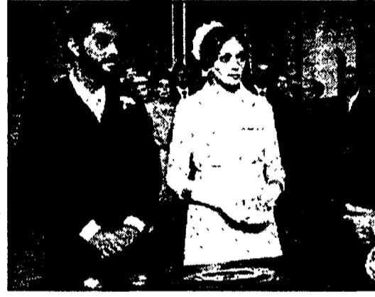
Una scena di «Per grazia ricevuta». In alto, Massimo Ranieri