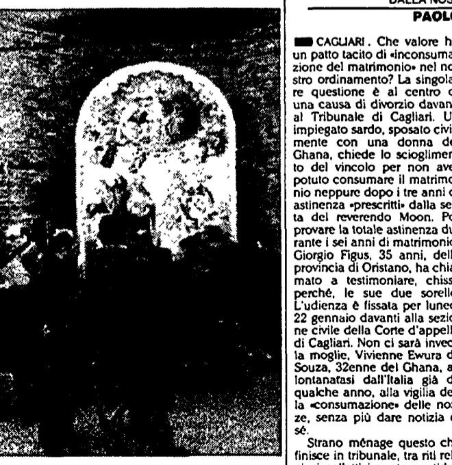
Il dipinto «Incoronazione della Vergine e quattro santi» di Botticelli esposto temporaneamente nella sala di San Pier Scheraggio

come ha ricordato ieri il soprintendente ai Beni artistici e storici di Firenze e Pistoia Antonio Paolucci, presentando agli Uffizi il restauro concluso, «questo ritorno di un'opera che potremmo definire "lungodegente" costituisce un evento memorabile per due motivi: uno è storico-artistico, in quanto abbiamo recuperato una pagina fondamentale dell'arte occidentale del '400; l'altro è che rappresenta un grande episodio nella storia del restauro italiano».