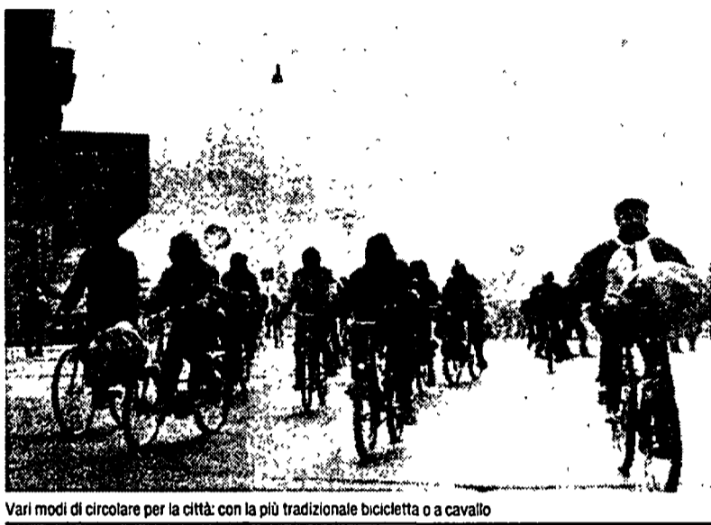
Vari modi di circolare per la città: con la più tradizionale bicicletta o a cavallo

campeggia sul piumino di un altro giovanissimo. Poco più in là, in piazza della Scala fanno bella mostra di sé le uniche macchine tollerate: quelle elettriche, che in Largo Cairoli faranno anche un giro dimostrativo.