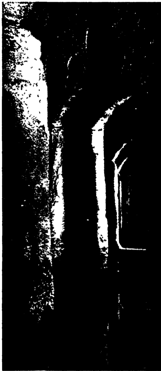
Sopra, le aperture di collegamento tra le «Sette sale». A destra una delle sale dove affluivano milioni di litri dell'Acqua Giulia

Sotto Colle Oppio c'è una vasta struttura termale Traiano le ha dato il nome e nelle «Sette sale» i romani si rinfrancavano corpo e anima. Il ninfeo accanto alle vasche è costellato di conchiglie