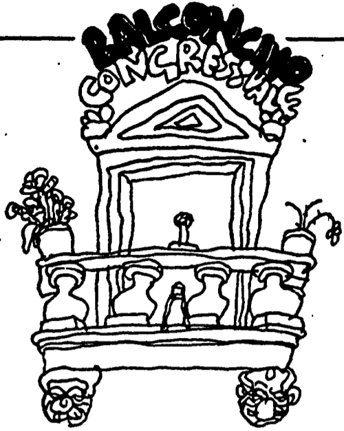
Il balconcino congressuale si affolla. Avanti! Sempre occhio alle cinque righe non più di cinque

FULVIO BELLA (Milano) - Una nuova forza politica: per fare cosa? Con chi? Per andare dove? Interrogativi senza risposta. Chi non risponde, di solito, all'esame lo bocciano.