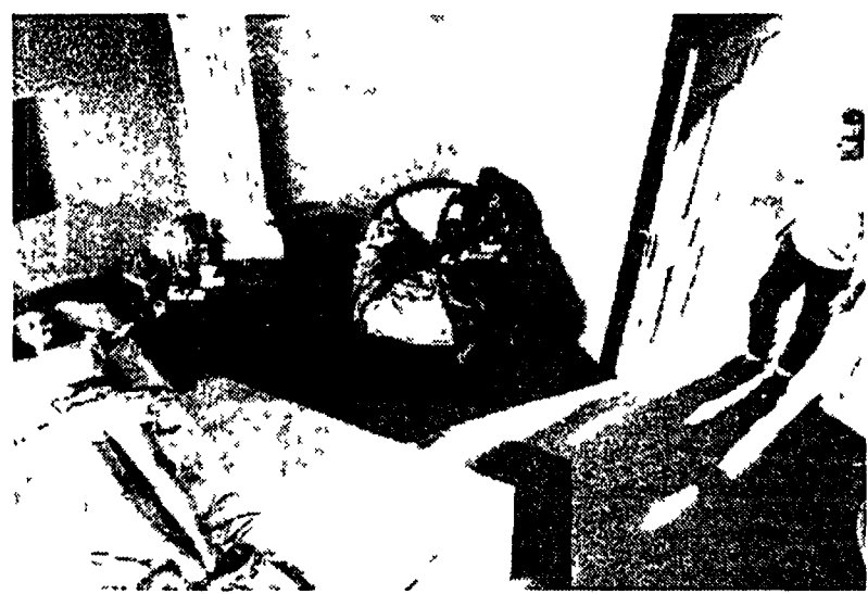
Gli interpreti di «Légami!» il nuovo film di Almodovar presentato a Berlino

Ma parliamo dell'atteso superreclamizzato Légami! di Pedro Almodovar. A noi tanto per mettere subito le cose in