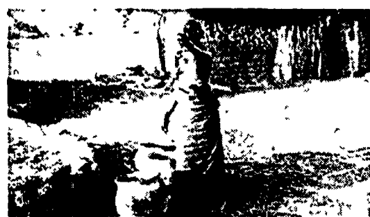
Una scena di «Yaaba» diretto dal giovane Idrissa Ouedraogo