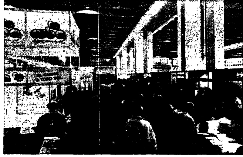
Il padiglione di Bit '90 a Milano. In alto: un stand di una delle 146 nazioni partecipanti.

Saranno presenti alla decima edizione della Borsa internazionale del turismo di Milano 3296 espositori, 1438 dei quali italiani e 1858 stranieri in rappresentanza di 146 nazioni.