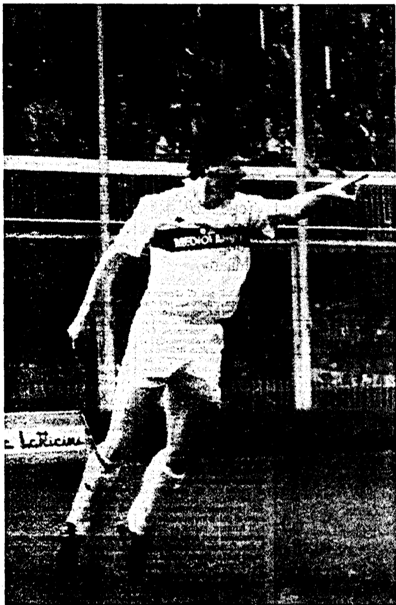
Il rossonerio Marco Van Basten, che ha segnato una doppietta, indica la strada che porta allo scudetto (sopra). A fianco, il delirante striscione esposto a San Siro: «Hitler con gli ebrei anche i napoletani»