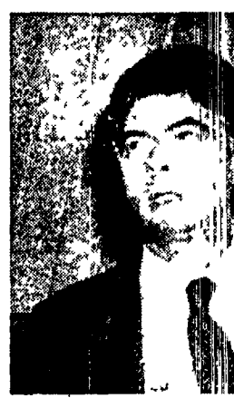
Il vicepresidente del Consiglio Claudio Martelli