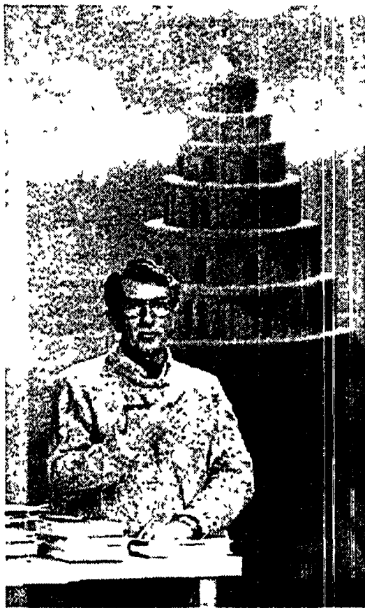
Corrado Augias, da venerdì su Raitre con «Babele». Sopra, Gabriele La Porta, conduttore di «Casablanca» su Raidue

Ma la tv può aiutare a leggere di più, a comprare più libri, a venderne di più? Nella sala Rai durante la presentazione di Babele c'erano anche i rappresentanti di alcune case editrici fiduciosi nell'iniziativa. Ma per Guglielmi «bisogna far giustizia di molti equivoci» una trasmissione di libri per lo più si rivolge a chi già legge o già ha letto (e cerca nuovi percorsi nuovi spunti). Babele vorrebbe fare qualcosa di più. Arrivare a quel pubblico che, armato di telecomando, trovi nel nuovo salotto televisivo un motivo di interesse per fermarsi. E scoprire un libro.