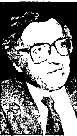
Giorgio La Malfa