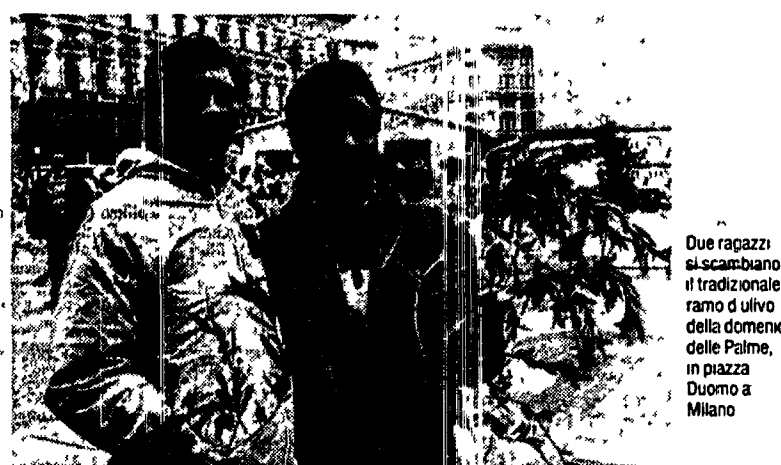
Due ragazzi si scambiano il tradizionale ramo di ulivo della domenica delle Palme, in piazza Duomo a Milano