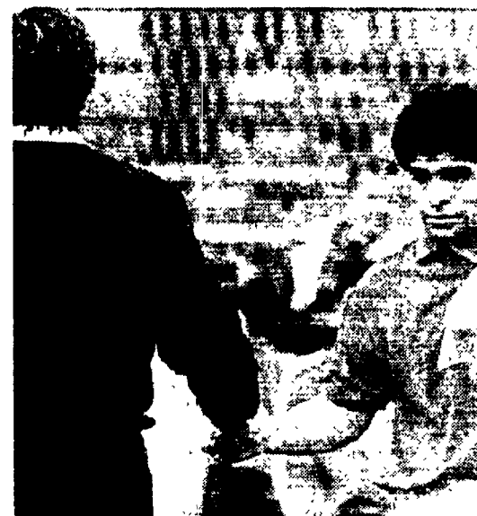
Maradona consegna all'arbitro un oggetto lanciato in campo

Maradona: «Agnolin ha raccolto le 100 lire»