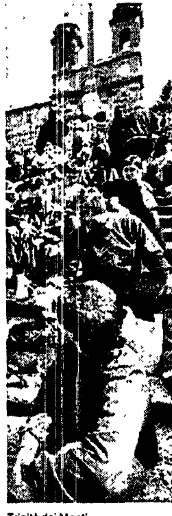
Trinità dei Monti

Non tutti hanno preso macchina e famiglia. La Pasqua in città per molti, ormai, è diventata una scelta. Ma con il primo «grande esodo» i servizi sono ridotti al minimo. Ecco una miniguide per «sopravvivere» senza eccessivi turbamenti. Trasporti. Niente paura. Atac e Acotral oggi e domani rispetteranno il classico orario festivo (5,30-22,30). Naturalmente aumenterà l'attesa alle fermate. Per il metro corse ogni sei minuti sulla linea A e ogni 8 sulla B. Soccorso stradale. Sarà un po' difficile trovare elettrouto o gommisti aperti. Il 116 dell'AcI il numero da usare in causa di sosta forzata. Farmacie aperte. Roma centro: via Fabio Massimo 74, via Cola di Rienzo 124, via XX Settembre 95a, via Tomacelli 1, via Nazionale 228, via Arenula 73, via Gioberti 79, via Me-