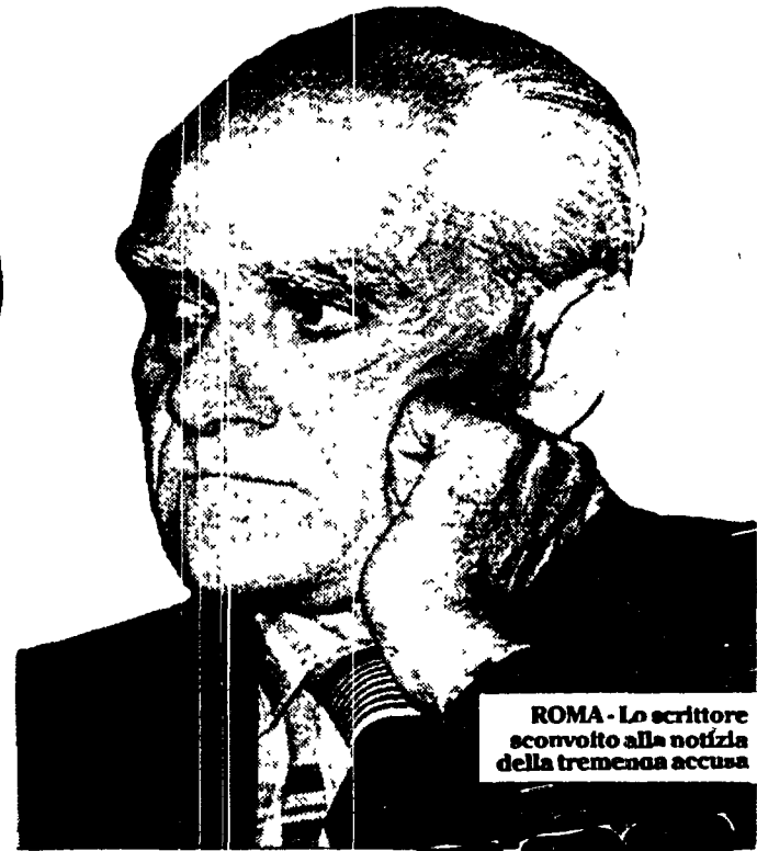
ROMA - Lo scrittore sconvolto alla notizia della tremenda accusa

IL CASO SOFRI CONFERMA: DIETRO OGNI CRIMINE SI NASCONDE UN INTELLETTUALE DI SINISTRA