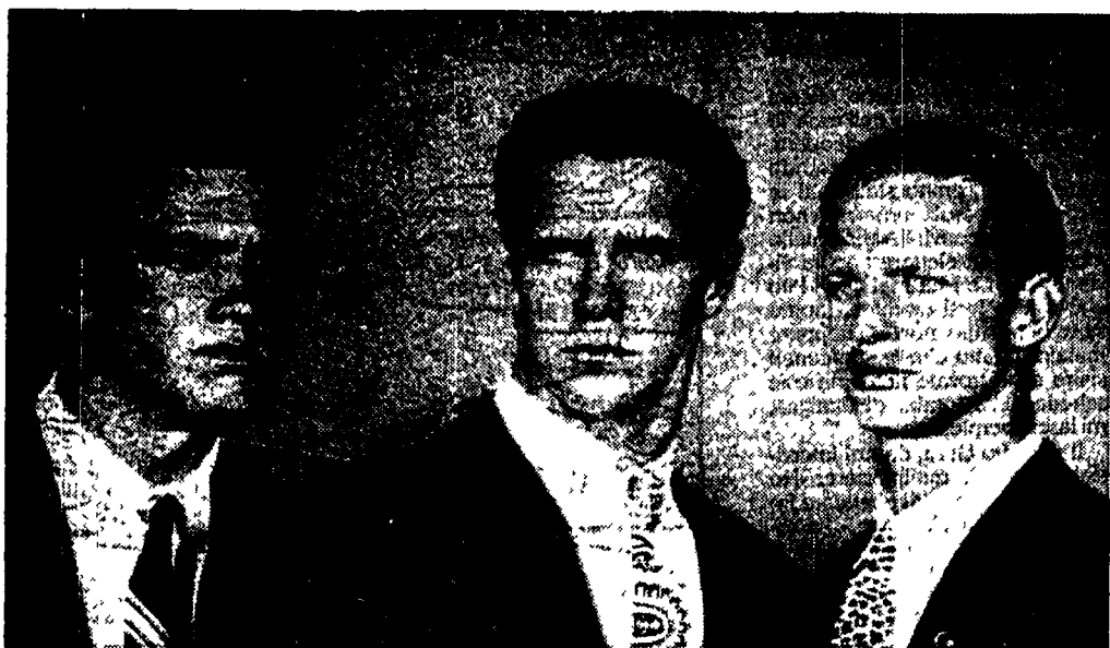
(pubblicità Versace su Panorama)