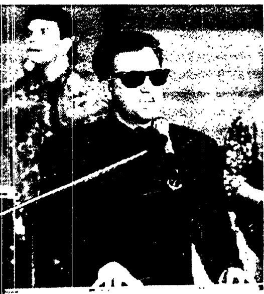
Billy Joel, un trionfo a Francoforte

Un'altra categoria che sparirà è quella dei vecchi pensionati ricchi, che dopo aver svernato sulla riviera affittano le proprie case, durante il festival, a prezzi vertiginosi.