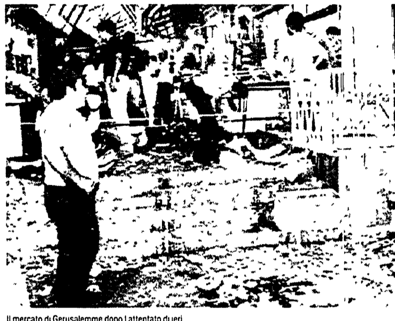
Il mercato di Gerusalemme dopo l'attentato di ieri