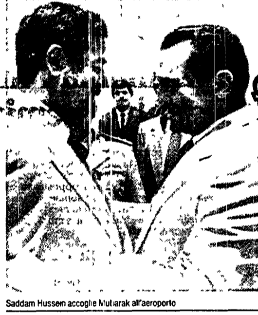
Saddam Hussein accoglie Mubarak all'aeroporto