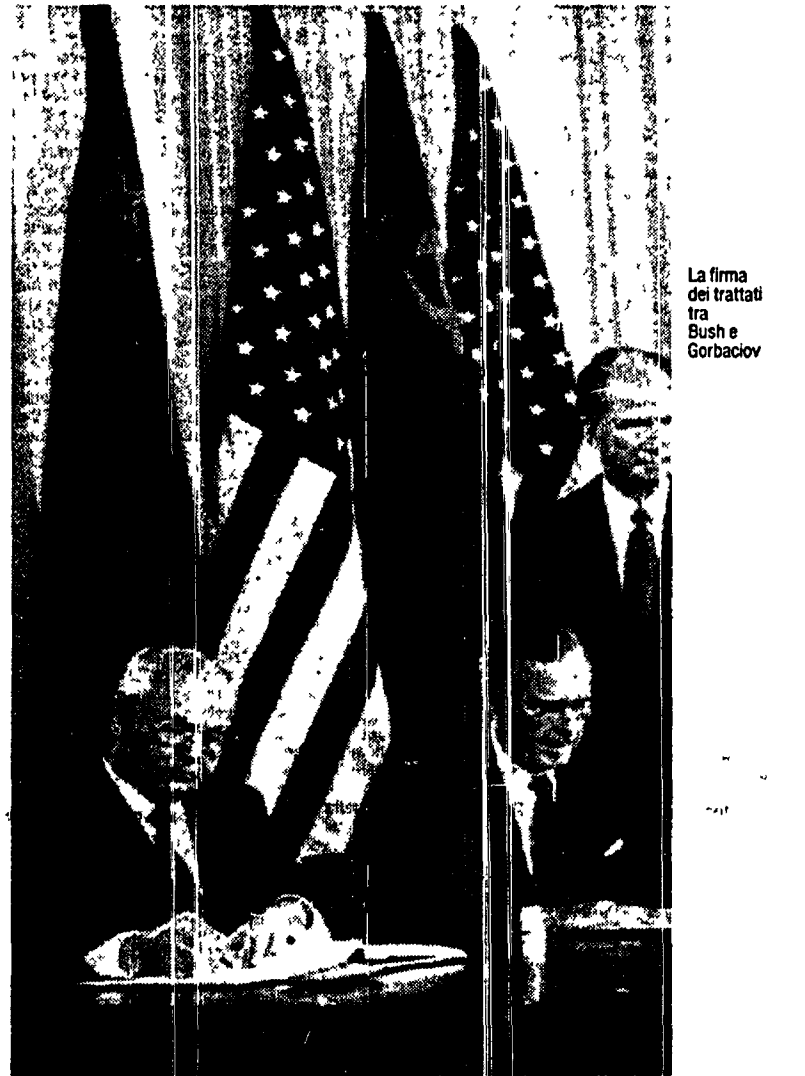
La firma dei trattati tra Bush e Gorbaciov