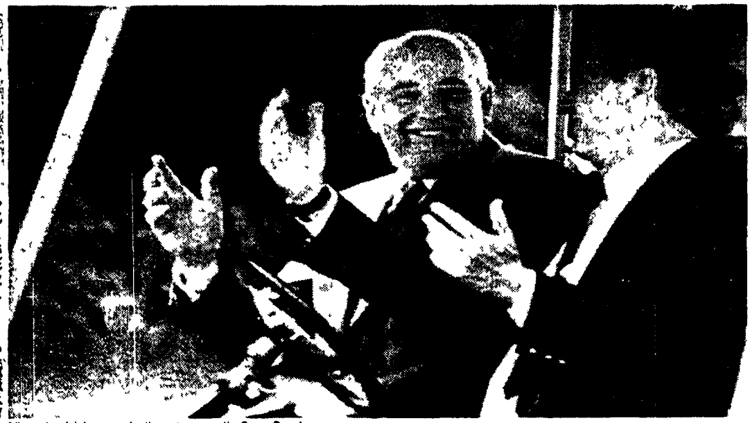
L'incontro dei due presidenti appena arrivati a Camp David