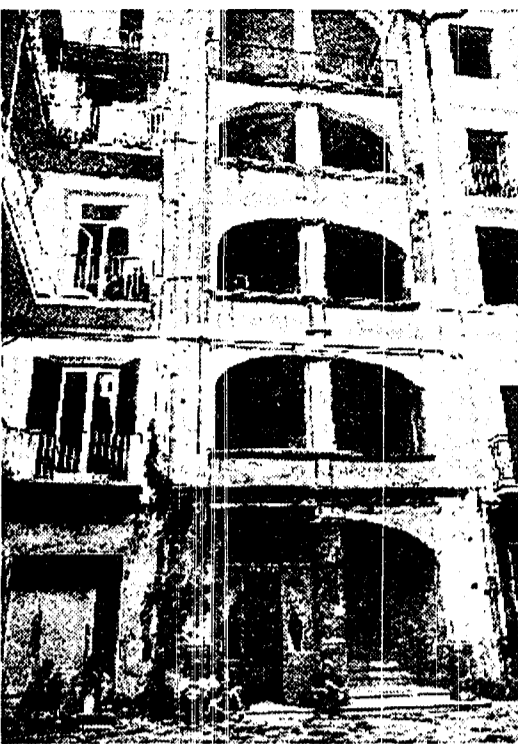
Palazzi del rione Sanità a Napoli