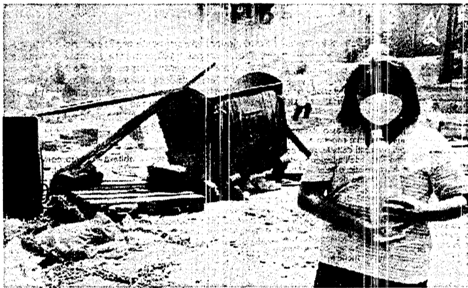
Una bambina munita di maschera ha conquistato una bottiglia di minerale durante i blocchi stradali di questi giorni. Sotto una emblematica pubblicità

cato l'interruzione, era stata lasciata inattiva. Nonostante le assicurazioni del commissariato, però, se tutto procederà per il meglio, ci vorranno almeno cinque giorni perché possa erogare del liquido trasparente.