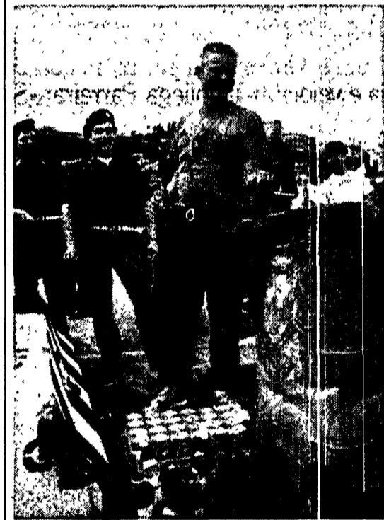
Un tifoso inglese costretto a distarsi da alcolici sotto gli occhi dei poliziotti