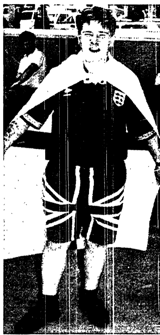
Un hooligan solo con la sua bandiera. Spesso gli ultras sono invisi anche ai connazionali.