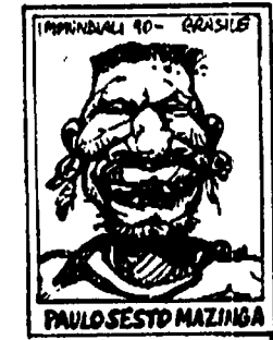
PAULOSEST MAZINGA (GEOVAN PAULO BISACIVESTOSTAN-TINOPOLIZATEA) HA UN VEZLO: PORTA ALL'OCORCINO SANITIZO IL CRANIO RIMPICCOLITO DI GUARDIERS.