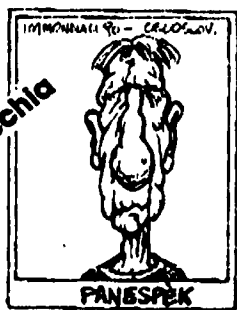
PANESPEK PORDRANTIA CETO DALLA NASCITA E CONSERVATO A MILLES TORCINO DOTTORCOVIA FRACON, SENTE CONTRO I ANZIANI.