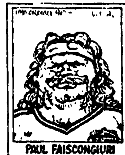
PAUL FAISCONGURI VICICANG DELLA SOCCERA BILINDONT LEAGUE, HA GIOCATO A COLMOS DI FELLS' APARTO NEL PAST FOOTBALL SU' PIANCINO UN RAGAZZO DI NOTOGLA.