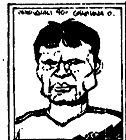
MATTHAUSEN PREDICAZIONE DAL BOVENON MONACO PREDICAZIONE IN ITALIA NEGLI PIVE NELLA LEGNA LAPPICAZIA, DORSO COTONIDA IL CENTRALISMO DI CANTAGRAMMIO.