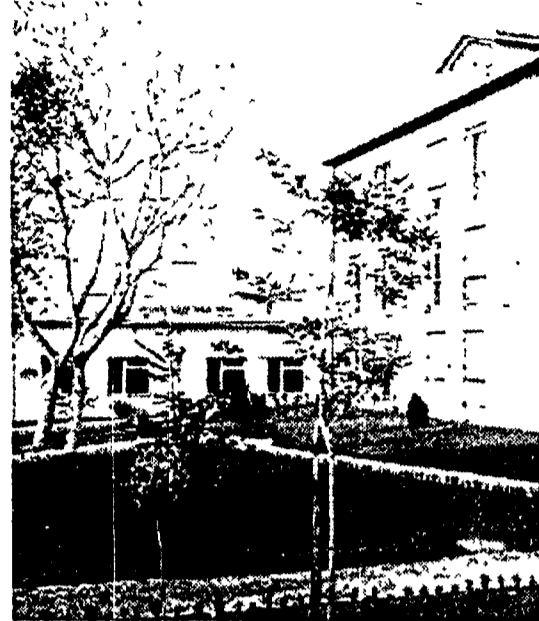
La scuola di partito di Frattocchie

Arrecia una settimana dopo i comunisti di Roma e del Lazio della seconda mozione si sono ritrovati veri a Frattocchie per discutere il loro ruolo nella nuova fase aperta all'assemblea nazionale. Il No romano indica forti terreni di confronto e cerca il dialogo con tutto il partito.