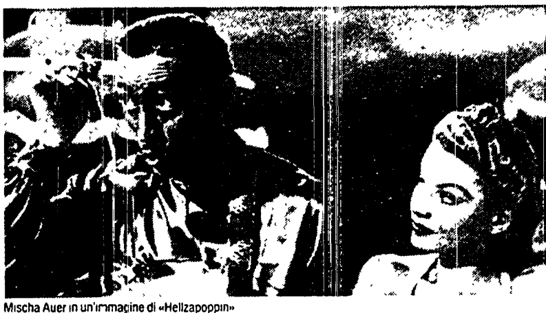
Misha Auer in un'immagine di «Hellzapoppin»

La sua esplosiva forza di urto. La commedia teatrale omonima ha tenuto banco a Broadway per 1104 repliche, a partire dal 1938.