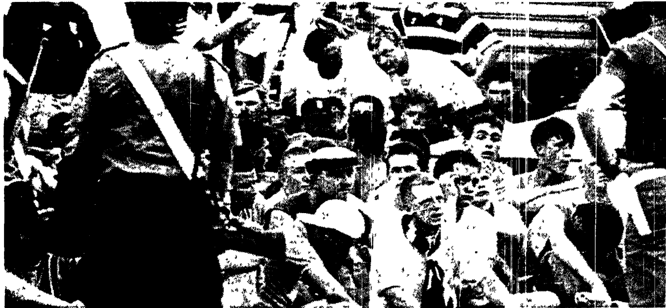
La nottata è passata. Carica di tensione e di paura, ma senza più incidenti. E Cagliari archivia così il suo giorno più lungo con un bilancio di otto arresti e una trentina di feriti.