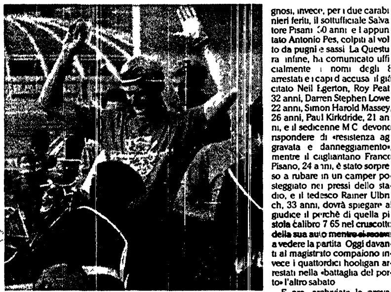
Un agente perquisisce un tifoso olandese all'ingresso dello stadio di Cagliari. In alto, un gruppo di hooligan circondati dalle forze dell'ordine in alto a destra, un tifoso inglese piange dopo una carica della polizia.