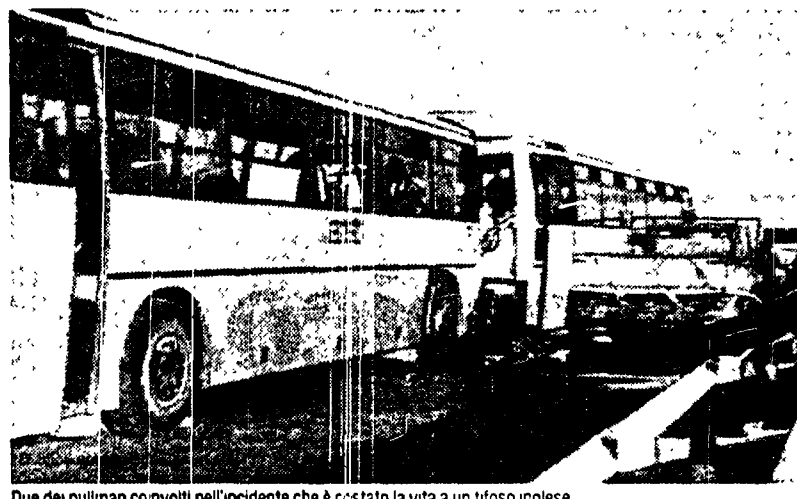
Due dei pullman coinvolti nell'incidente che è costato la vita a un tifoso inglese