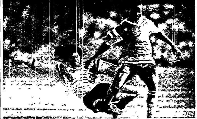
Milla supera Higuita e realizza la seconda rete per il Camerun