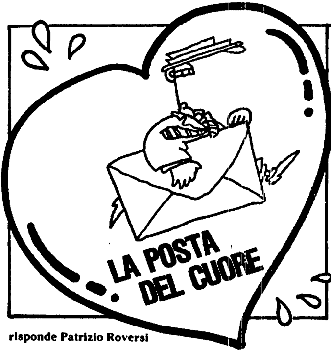
risponde Patrizio Roversi