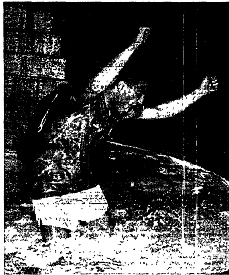
Il bagno nelle fontane, un classico del dopo partita