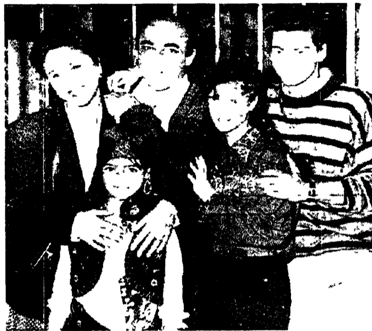
La famiglia di «Chiara e gli altri» tornerà su Italia 1 a febbraio

Da questa situazione la vicenda si snoda in varie direzioni sviluppando una sorta di «commedia all'italiana» una tipica famiglia medio borghese non riesce a trovare pace perché i genitori non vanno d'accordo. Lui è un padre un po' calzone e svagato che fa il