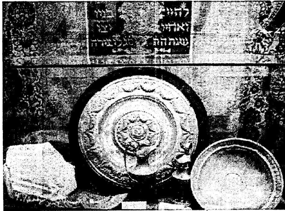
Oggetti rituali, e sotto, alcuni antichi manoscritti. A lato, l'interno della Sinagoga di Lungotevere. In alto, il rabbino capo Elio Toaff