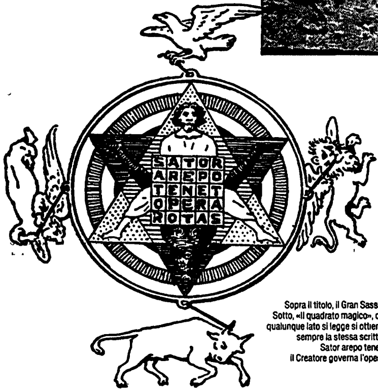
Sopra il titolo, il Gran Sasso. Sotto, «il quadrato magico», da qualunque lato si legge si ottiene sempre la stessa scritta: Sator arepo tenet, il Creatore governa l'opera.

setta (in tre ordini sovrapposti al di sopra di un velano). Da un'iscrizione posta sull'architrave del rosone del fronte posteriore, ricaviamo che la fondazione del primitivo sacello risale a Carlo Magno, mentre la sua ricostruzione del 1263, all'abate Teodino Verosimilmente a quest'epoca risalgono pure le pitture interne. Come in un prezioso cofanetto, la decorazione svolge nelle pareti e nella volta i temi riguardanti l'infanzia del Cristo, il ciclo della Passione, la storia di S. Pellegrino (titolare dell'oratorio), il Giudizio Finale e il calendario Valvense. Quest'ultimo tuttavia è quello che attrae maggiormente la nostra attenzione data la sua rarità e singolarità. I mesi vi sono infatti illustrati secondo i segni zodiacali e l'attività relativa nei campi, i giorni invece sono rappresentati in ordine alfabetico anziché numerico (a b c d f g). Vi compaiono inoltre le festività proprie della Diocesi di Valva da cui il nostro monastero traeva dipendenza. Il pittore di probabile provenienza locale, si è dun-