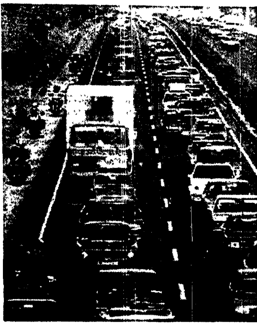
Anche quest'anno traffico intenso sulle autostrade per l'esodo di fine luglio