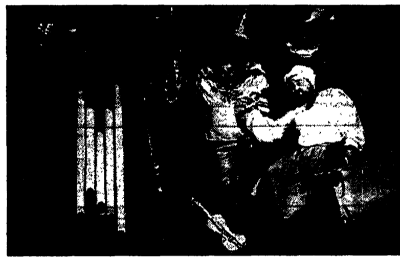
Uno spettacolo del Teatro Nero di Praga: in alto a sinistra, la locandina di «La trappola»; sotto, «Cupole» di Miriam Glanzmann e Alvaro De Araujo Lobo

dicato a Zeus e agli altri dei dell'Olimpo. La giornata conclusiva, dedicata alla musica, oltre ai «Canti del grano e a Dione e Enea» di Purcell propone un'esecuzione di brani sul tema di Giove. Infine, ma non ultimo spettacolo in ordine di importanza, al teatro San Filippo di L'Aquila andrà in scena sabato e domenica alle ore 21 «Alice nel paese delle meraviglie», con la compagnia del «Teatro Nero di Praga» diretta da Jiri Smec. Fondata nel 1961, la compagnia debuttò l'anno successivo al festival di Edimburgo, presto elevandosi nei più alti cieli della drammaturgia ceca.