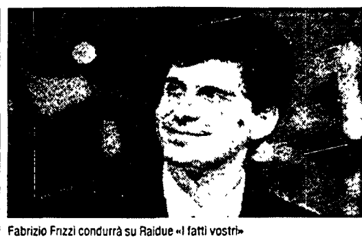
Fabrizio Frizzi condurrà su Raidue «I fatti vostri»

Fra i tanti dati del dossier, tutti allarmanti, ma che ormai, purtroppo, non stupiscono più, ce n'è uno abbastanza nuovo: il 59,36% dei tossicodipendenti sono occupati, contro il 35,12% di disoccupati, il 3,07% di occupati saltuariamente ed il 2,45% di studenti. Un quadro che ribalta l'immagine, in fondo comoda, del tossicodipendente come vittima dell'emarginazione sociale, della disoccupazione e della povertà. Alla fine, fra gli intervenuti, l'unica voce critica (non del programma né del servizio, ma sul «che fare», sul «come farlo e sulla nuova legge antidroga») è stata quella di Don Rigoldi. Dopo aver sottolineato che di dati quantitativi ce ne sono parecchi, mentre invece mancano quelli qualitativi e analitici, ha fatto appello allo Stato perché faccia anche la sua parte, fornendo le strutture che operano di personale e di strumenti qualificati.